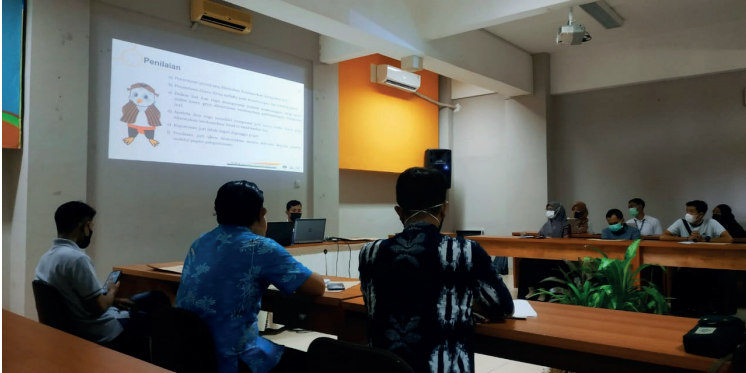
TM Cabang Lomba Debat Konstitusi, University Hotel, Sambilegi, Selasa (22/6).

Sedangkan perlombaan yang dilakukan secara daring dilakukan melalui zoom meeting. Berikut adalah ruang zoom, ruang pelaksanaan serta waktu perlombaan dari setiap cabang lomba yang dilaksanakan pada hari Selasa: