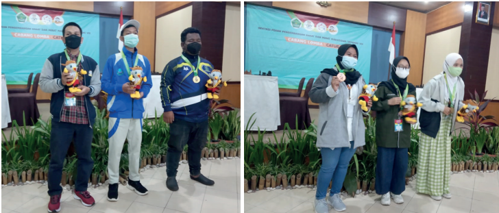
Para juara Catur Kilat Putra dan Catur Kilat Putri berpose sesaat setelah pengalungan medali, Selasa (22/6).

Cabang lomba yang dilaksanakan secara luring pada hari Selasa tanggal 22 Juni 2021 dan sudah diumumkan pemenangnya, untuk medali, winner board dan maskot diserahkan secara langsung setelah selesai perlombaan. Seluruh rekap nilai dan medali perlombaan pada hari Selasa langsung direkap dan diinputkan ke sistem.