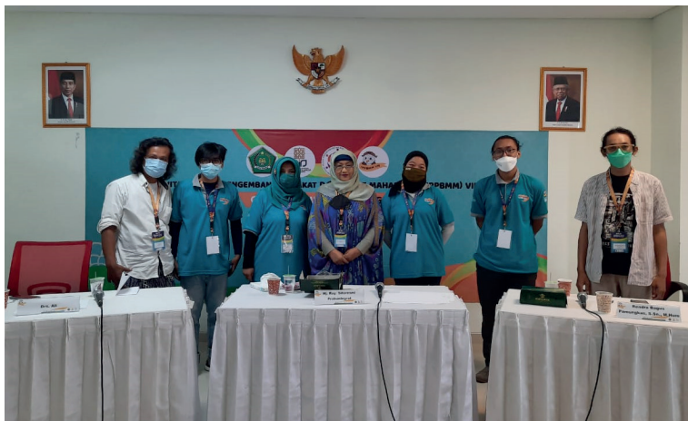
Panitia dan Juri Cabang Lomba Monolog berpose sejenak setelah selesai penilaian, Kamis (24/6).