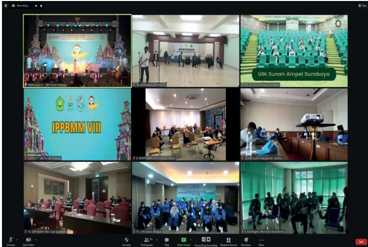
Tampilan zoom saat Upacara Pembukaan IPPBMM VIII Tahun 2021, Senin (21/6).

Acara Pembukaan berlangsung dengan lancar dan dimeriahkan oleh beragam penampilan tradisi kesenian. Salah satu pengisi acara pembukaan adalah UKM Kalimasada yang menampilkan Tari Wisang Sanjaya khas Gunungkidul. Tarian ini sengaja dipilih untuk prosesi pembukaan IPPBMM yang mengisahkan tentang prajurit. Kisah prajurit ini sedang berlatih untuk mempersiapkan pertandingan.