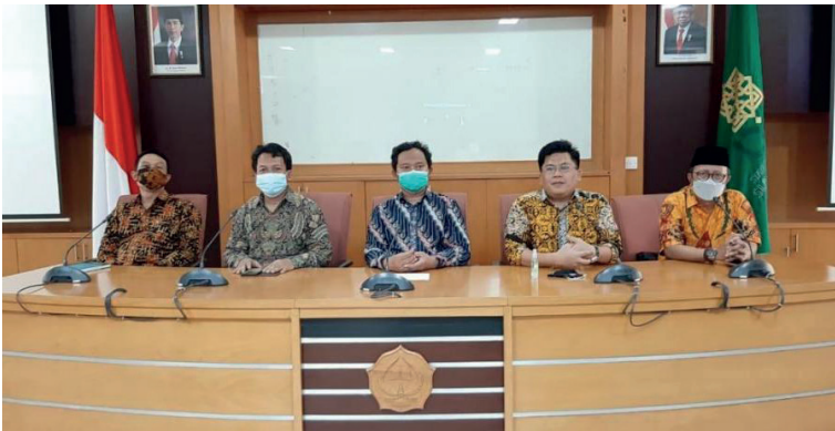
Sosialisasi Juknis dan Persiapan Pendaftaran Kontingen IPPBMM VIII Tahun 2021, Ruang Rapat PAU Lt. 2 UIN Sunan Kalijaga Yogyakarta (luring) dan Zoom Meeting (daring), Kamis (12/3).

Pada hari Kamis tanggal 11 Maret 2021 diterbitkan versi penyempurnaan Petunjuk Teknis IPPBMM VIII Tahun 2021. Setelah penyempurnaan Juknis, panitia melaksanakan rapat secara hybrid dengan topik pembahasan agenda Sosialisasi Juknis dan Persiapan Pendaftaran Kontingen IPPBMM VIII Tahun 2021 pada hari Jumat tanggal 12 Maret 2021 .